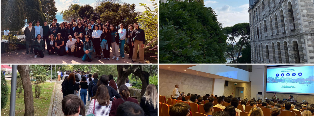
Rehberlik Birimimiz ile birlikte yapılan Boğaziçi Üniversitesi tanıtım gezimizden görüntüler.